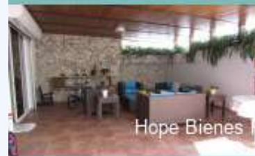
Hope Bienes Raíces