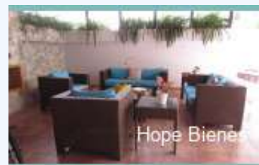
Hope Bienes Raíces