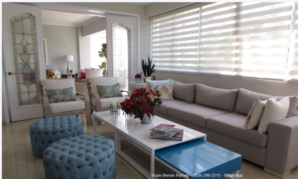
Hope Bienes Raíces - (809) 299-2510 - WhatsApp