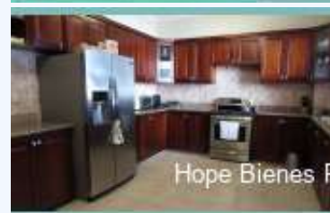
Hope Bienes Raíces